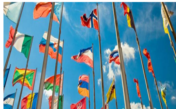
Schéma na podporu medzinárodnej spolupráce (schéma pomoci de minimis)

Podopatrenie 1.1.3 – Podpora účasti slovenských výrobcov na veľtrhoch, výstavách, obchodných misiách